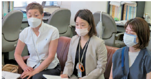
報道機関からの取材に対応する「岡山市の水道料金を考える会」のメンバー