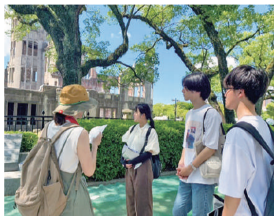
原爆ドームの前で説明を聞く医学生