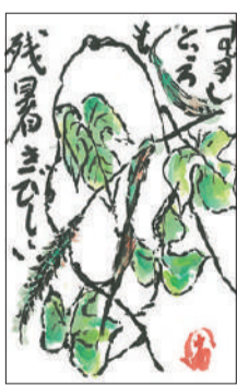
岡山市中区 井上 草