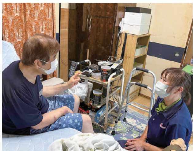
利用者さんに寄り添う

ヘルパーステーション・レインボーは介護保険が始まった2000年に事業を開始しました。当時は組合員活動として「助け合いの会」が活発に活動しており、「わかく