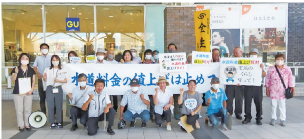
岡山駅での署名活動

水にのみならず、余剰水はかえって地元の環境破壊を起していることが報告されています。その大きな費用負担も市民にかかっています。また、岡山の吉井川、旭川、高