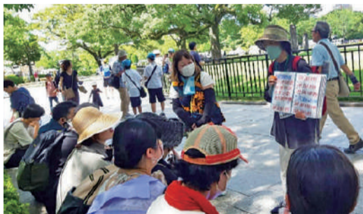
現地での学習風景