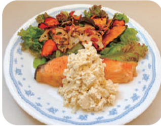
焼き野菜を添えてカラフルに