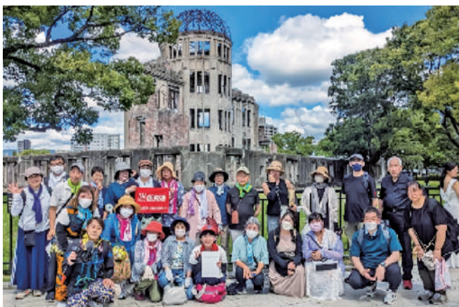
2023年ツアー参加者とともに

8月6日(日)、78回目の慰霊の日、私は4年ぶりに広島バスツアーに参加しました。